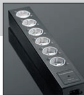
GigaWatt PF-1 – niedroga, bardzo dobrze wykonana listwa do sprzętu średniej klasy. Nie degraduje brzmienia, zapewniając potrzebną ochronę. Ma wskaźnik uzmiennia.