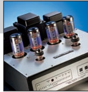
Audio Research VS160 – lampowiec, który zaprzecza stereotypowi. Fantastyczna relacja jakości do ceny w grupie urządzeń high-end.

rodzaj (Tranzystorowy, Lampowy, Hybrydowy) moc na kanał przy 8 Ω wejścia XLR liczba wejść liniowych wejście gramofonowe (MM/MC) zdalne sterowanie numer AUDIO-VIDEO