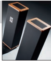
Vandersteen 1Ci – ulepszona wersja kolumn, które – wydawałoby się – przy tej cenie (6400 zł) nie mogą być lepsze. A jednak! Okazja, jakich mało...